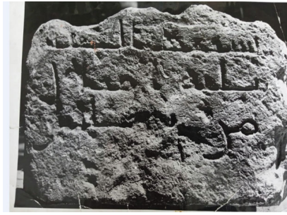
დანართი № 1