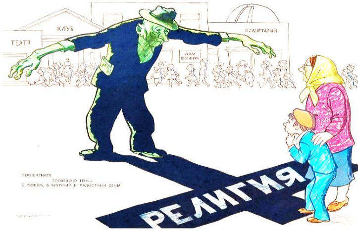
გადააბიჯე ამ ბოროტ ჩრდილს და მხიარულ საზოგადოებას შეუერთდი