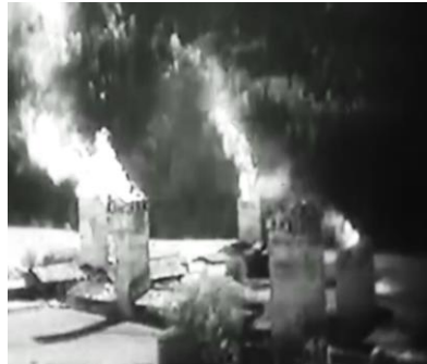
სამგლოვიარო კვამლი ფილმი „ჯიმ შვანთე“, 1930

ფილმში მოცემულია, ასევე, სხვადასხვა წარმართული რიტუალი (ტიტრებში ნათლად ჩანს ამ საკითხთან დაკავშირებული ნეგატიური დამოკიდებულება). ბავშვის დაბადებასა და მიცვალებულის კულტთან დაკავშირებული ტრადიციების ელემენტები (სამგლოვიარო კვამლი, დატირება, სახალხოდ ლოცვა, ხარის შეწირვა, მიცვალებულის სულის საიქიოში გადამრძანების დალოცვა).