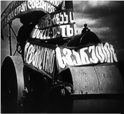
ფილმი „ჯიმ შვანთე“, 1930

კვლევები საქართველოში ადასტურებს, რომ ცხენის მიცვალებულის კულტთან დაკავშირებული წეს-ჩვეულებები მნიშვნელოვანი იყო სვანებისათვის. სვანები დასაფლავების დღეს ცხენს საუკეთესოდ მორთავდნენ და პატრონის კუბოს მახლობლად დააყენებდნენ. გასვენებისას ამ ცხენზე ახალგაზრდა სვანი შეჯდებოდა და სამგლოვიარო პროცესიის წინ პირუტყვს მოკვდინებამდე აჭენებდა, რათა თავის პატრონთან ერთად საიქიოში „გამგზავრებულიყო“ (გიორგაძე, 1987:11-14; ბალიაური, 1940: 29 - 57; მაკალათია, 1984: 203-204; ოჩიაური, 1940: 77; ხიზანიშვილი, 1940:76-77). ეს ეთნოგრაფიული ნიუანსები ფილმში კომპეტენტურად არის ასახული (ფილმი „ჯიმ შვანთე“, 1930).