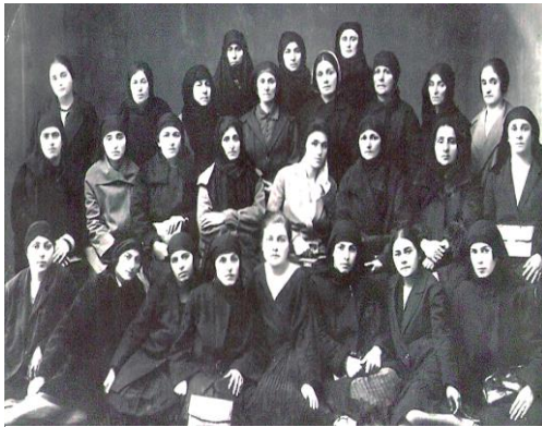
ასსცსა, ფოტოფონდი, ან. 1, ფოტო 20 ქალები, რომლებმაც პირველებმა

„აჭარელ ქალთა ყრილობა“ – ასე არის დასათაურებული ეს კინოქრონიკა. კადრებში ჩანს, რომ ბათუმის ძველ რკინიგზის სადგურში შემოდის მატარებელი, რომელსაც ხალხი ტრანსპარანტებით ეგებება. მატარებლიდან საქართველოს სახალხო კომისართა საბჭოს თავმჯდომარე ფილიპე მახარაძე ჩამოდის და თანმხლებ პირებთან ერთად ბათუმის ქუჩებში დადის. მსვლელობაში მამაკაცებთან ერთად ქალებიც მონაწილეობენ, თითქმის ყველა მათგანს თავსაფარი ახურავს, ზოგს ჩადრიც უკეთია. მსვლელობის შემდეგ კადრში ჩანს სცენა, რომელიც ქუჩაშია მოწყობილი, სცენაზე დგას უჩადრო ქალი, კადრი გადადის კოცონზე, სადაც ჩადრები იწვის (რმქა, 22.05.2015). აღნიშნულთან დაკავშირებით უნდა აღინიშნოს, რომ ანტირელიგიურ პოლიტიკაში ერთ-ერთი ყველაზე მნიშვნელოვანი კომპონენტი ქალთა საკითხი იყო. 1920-იან წლებში იქმნება ე. წ. ქალთა კომიტეტები, რომლებიც კურირებას უწევდნენ ამ საკითხებს. ქალთა კომიტეტები საოჯახო, ყოფით, სამართლებრივ, საქორწინო და სხვა საკითხებში მხარს უჭერდნენ ქალებსა და მათ ჩაბმას საზოგადოებრივ საქმიანობაში ( აცს ცსა ფონდი 3-1, ან. 1, საქ. 358, ფურც. 18).