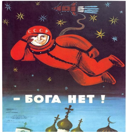
იური გაგარინის კოსმოსში გაფრენასთან დაკავშირებული პოსტერი - ღმერთი არ არის